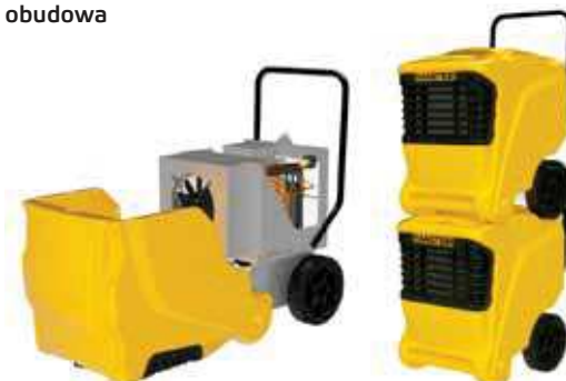
Łatwo można go otworzyć do czyszczenia