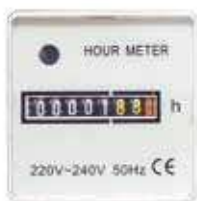
Licznik czasu pracy