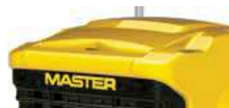
Wytrzymała, odporna plastikowa obudowa